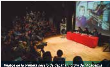
Imatge de la primera sessió de debat al Fòrum de l'Acadèmia

La primera edició del fòrum va acollir dues sessions de debat. La primera, dedicada a l'educació musical i el seu vincle amb el món laboral, es va iniciar amb una xerrada del director de música de l'Arts Council England,