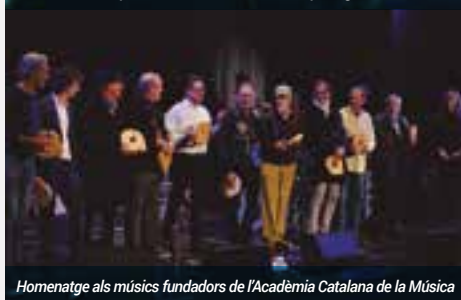
Homenatge als músics fundadors de l'Acadèmia Catalana de la Música