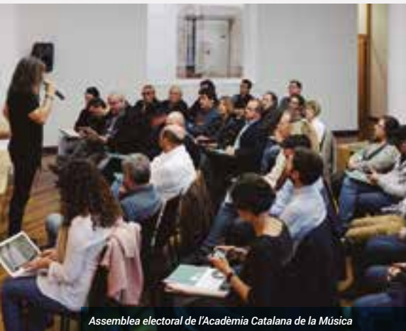
Assemblea electoral de l'Acadèmia Catalana de la Música

Associació Catalana d'Intèrprets de Música Clàssica (ACIMC), Associació d'Escoles de Música (ACEM), Associació Catalana d'Orquestres Professionals (ACOP), Associació Catalana de Compositors (ACC), Associació de Festivals de Jazz (AFEJAZZ), Associació d'Editorials Musicals (AEDEM), Cases de la Música, Federació de Joventuts Musicals de Catalunya, Federació Catalana de Societats Musicals, Federació Catalana d'Entitats Corals (FCEC), Fundació Taller de Músics, Fundació Conservatori del Liceu, Gremi d'Editorials de Músics (GEMC), Mercat de Música Viva de Vic (MMVV), Orquestra Simfònica del Vallès (OSV), Productors Associats de Fonogrames (PAF) i Escoles de Música d'Iniciativa Privada de Catalunya (EMIPAC).