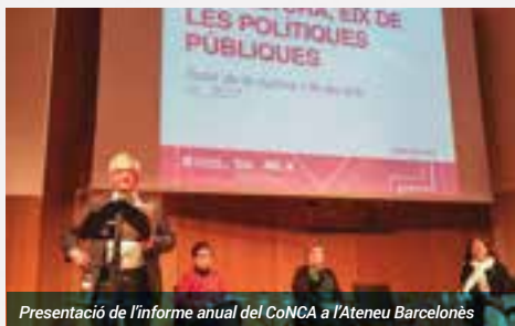
Presentació de l'informe anual del CoNCA a l'Ateneu Barcelonès

El text es clou amb unes recomanacions sorgides d'aquest treball de reflexió col·lectiva, per a cadascun dels vuit apartats esmentats.