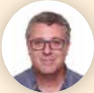
Josep Reig President de MUSICAT

No volia parlar de política, però el moment complicat que estem vivint ho fa inevitable.