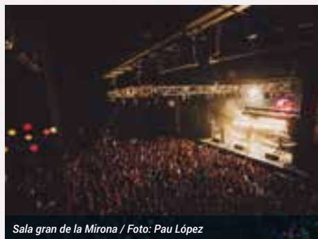
Sala gran de la Mirona

La programació del 15è aniversari busca apropar la música a totes les edats i reforçar el caràcter social de la sala. De setembre a març hi ha confirmades més de 40 formacions musicals de caràcter nacional, estatal i internacional. També es presentarà un festival nou, el Girona Sona, amb KOP, Gatillazo, Deskarats, Lendakaris Muertos, Buhos, Lágrimas de Sangre, Ebri Knight i Aspencat, el primer cap de setmana de febrer. Finalment, per tal d'acostar la cultura als més joves, la direcció de La Mirona ha decidit que tots aquells que compleixin 18 anys en el decurs d'aquesta temporada podran gaudir d'un concert gratuït.