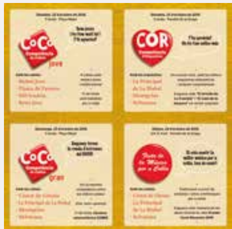
Pòster competència de cobles

el CoCo. La Competència de Cobles es farà durant dos dies: el dia 22 d'octubre la competència serà entre quatre cobles de músics joves: la Bisbal Jove, la Flama de Farners, la Mil·lenària i la Reus Jove, amb un fi de festa amb ballables per a cobla. L'endemà, la Plaça Major l'ocuparan quatre cobles de prestigi que competiran entre elles: Ciutat de Girona, La Principal de La Bisbal, Montgrins i Selvatana. Com a fi de festa interpretaran la sardana estereofònica Somni .