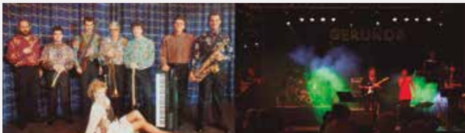
L'Orquestra Gerunda el 1991 / L'Orquestra Gerunda en l'actualitat

Recentment, han estat nominats als Premis ARC 2016, en la categoria de millor gira per festes majors de grups de ball.