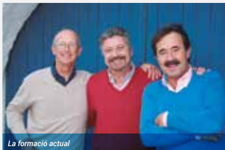
La formació actual

de Habaneras de La Habana els anys 1989, 1991, 1992, i 1993. Han actuat a Israel (2004), Síria i el Líban (2007), Turquia (2009) i Japó (2013), entre d'altres països. La popularitat del grup va fer que l'any 1995 el seu disc Arrel de tres s'enfilés al vuitè lloc dels discos en català més venuts, fet absolutament insòlit tractant-se d'un disc d'havaneres. L'any 2005 van actuar al Palau de la Música. Amb això també van ser pioners perquè va ser el primer cop que s'inclouien havaneres a la programació estable del Palau.