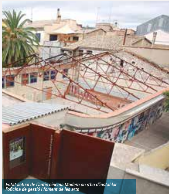
Estat actual de l'antic cinema Modern on s'ha d'instal·lar l'oficina de gestió i foment de les arts

El pressupost del PECT puja a 4,43 milions d'euros, dels quals la Diputació i l'Ajuntament