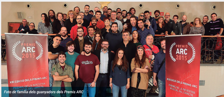
Foto de família dels guanyadors dels Premis ARC

Aquestes comissions temàtiques estan integrades per membres del Departament de Cultura i d'altres departaments implicats, associacions, escoles, conservatoris, equipaments, festivals i altres actors del sector de la música. Les reunions van començar a finals de novembre i continuen aquest any 2016. MUSICAT participa activament en les comissions que tracten l'estructuració del sector; creació, producció i exhibició; música moderna "amplificada" i jazz; i la pràctica no professional i semiprofessional.