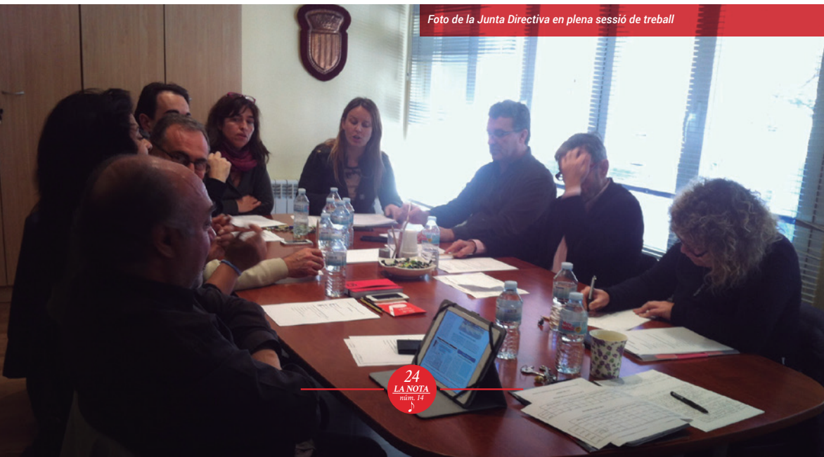
Foto de la Junta Directiva en plena sessió de treball